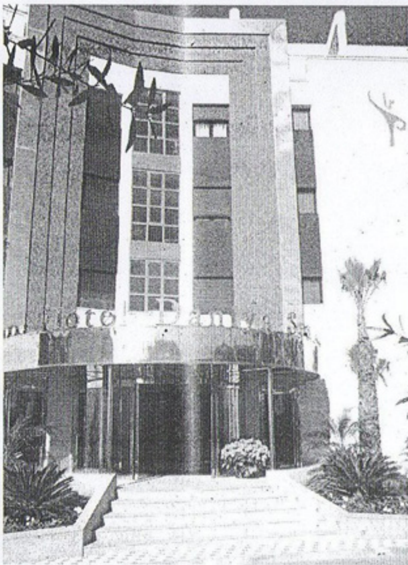
Fachada del hotel Daniya

El Hotel Daniya -Spa & Bussines- de 4 estrellas, es un nuevo concepto de hotel de reciente apertura en Dénia, el cual está dotado de la última tecnología en domótica e informática.