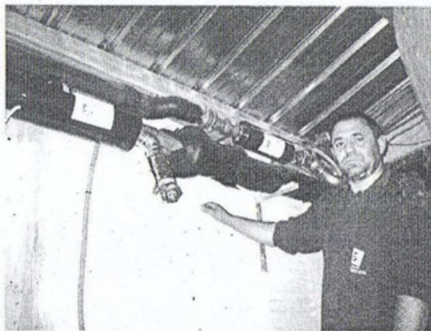
Sistema AQUASONIC en las tuberías suministradoras del agua caliente

baños, grifería en general...) eliminando los problemas de la obstrucción en sus tuberías y alargando la vida útil de los electrodomésticos (planchas, lavavajillas, limpiadores